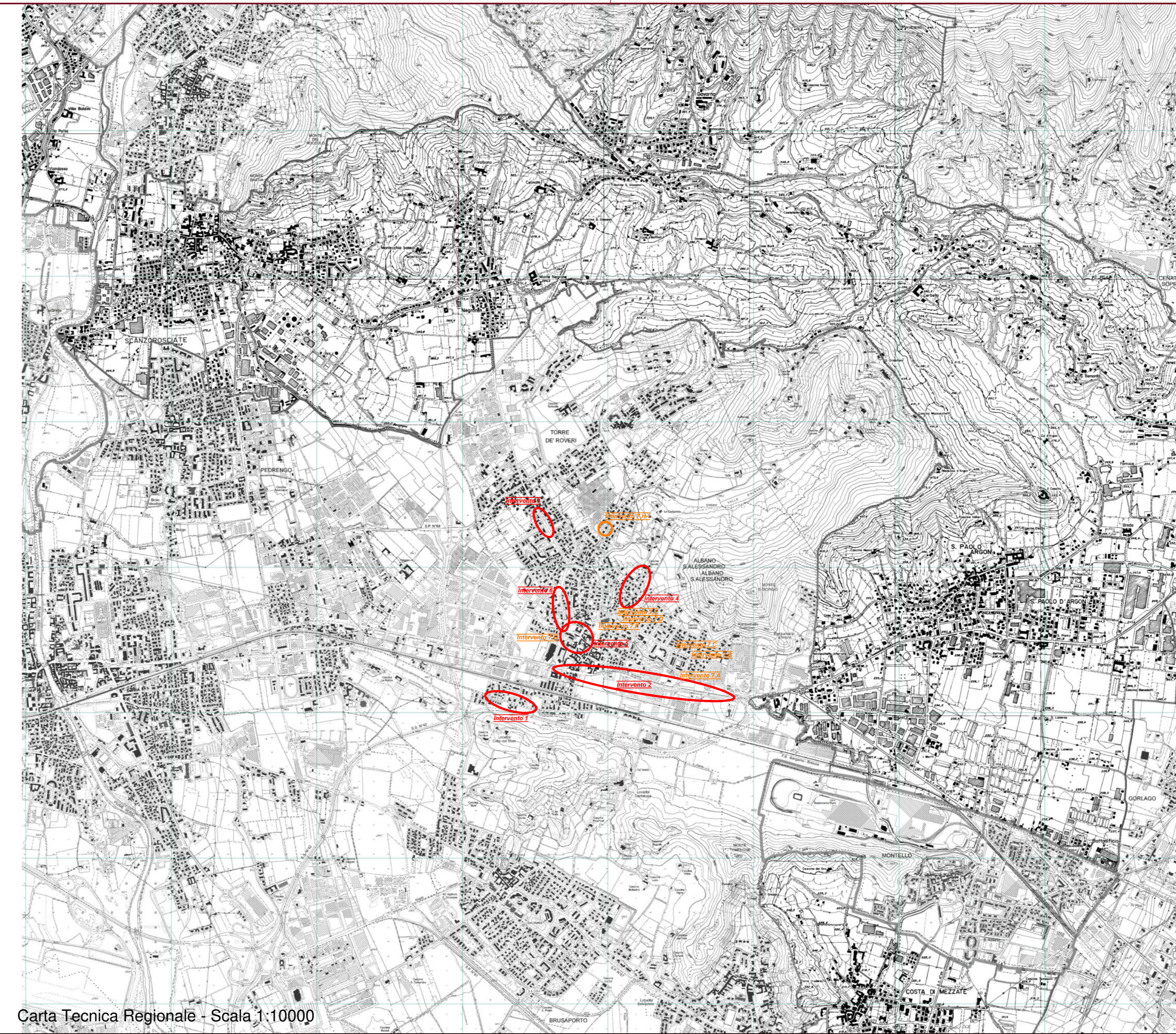
Carta Tecnica Regionale - Scala 1:10000