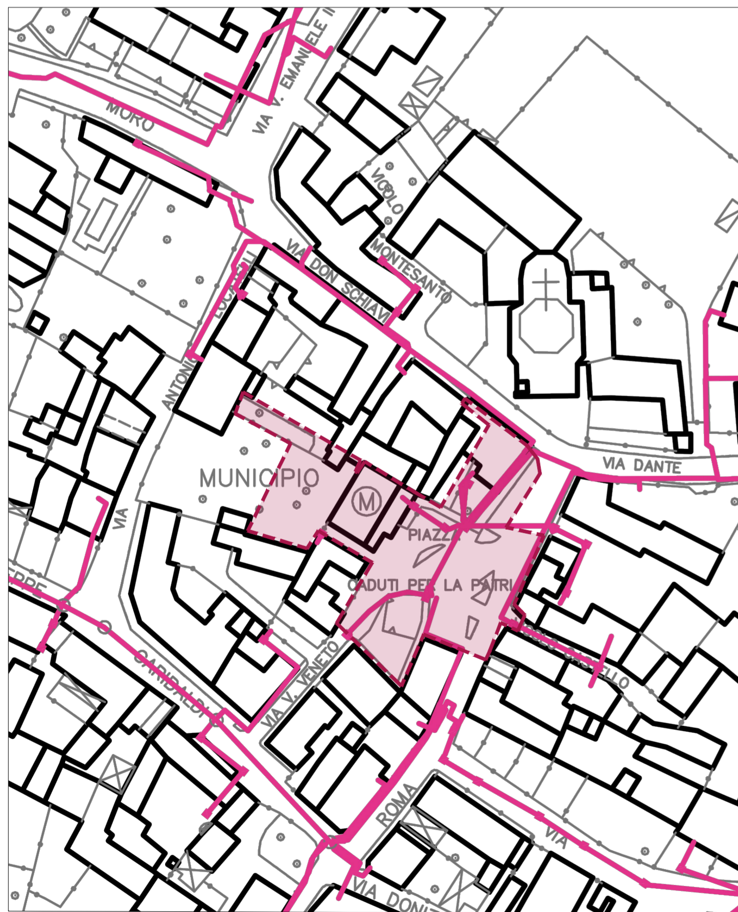
RETE TELEFONICA SCALA 1:1000