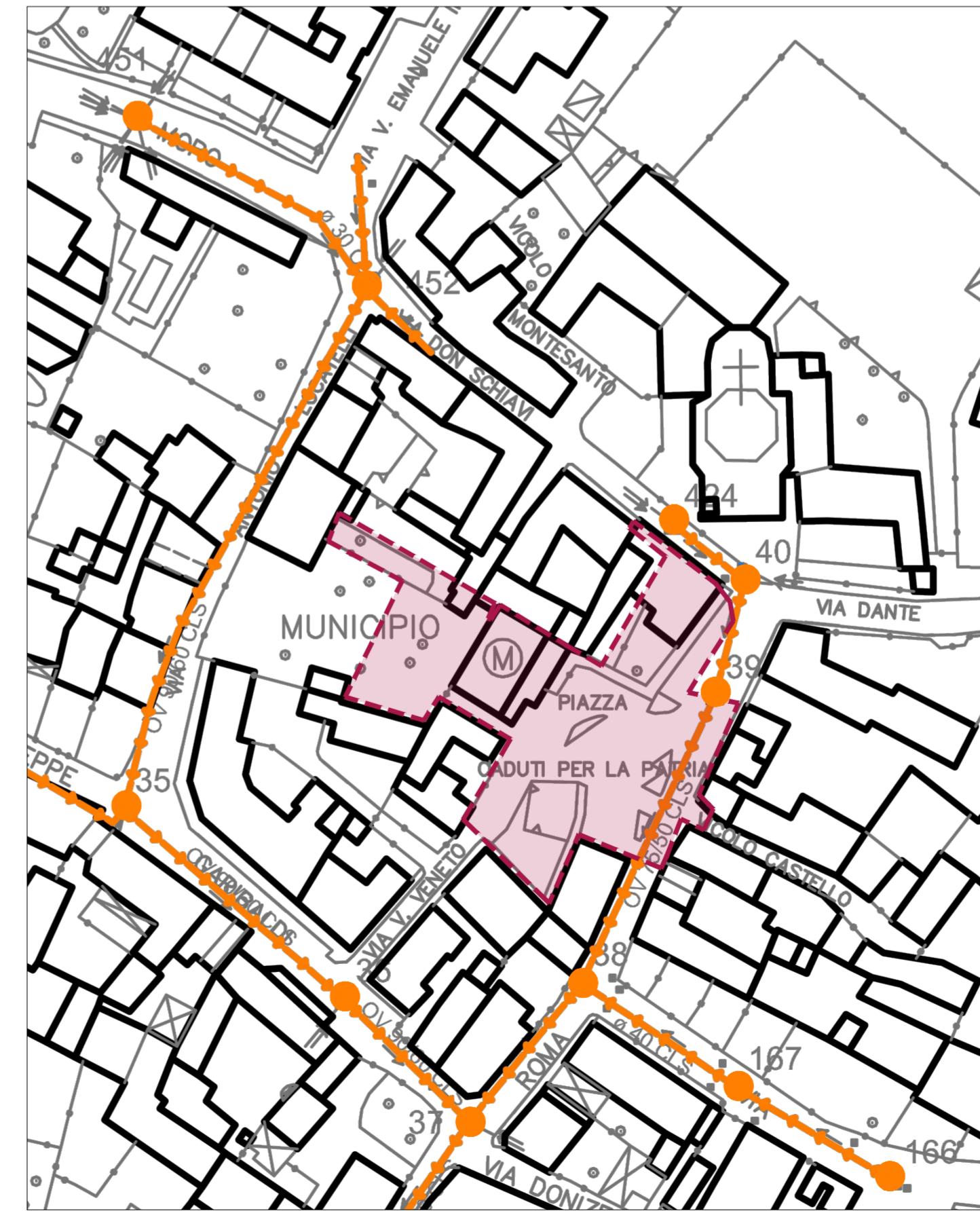
SISTEMA FOGNARIO SCALA 1:1000